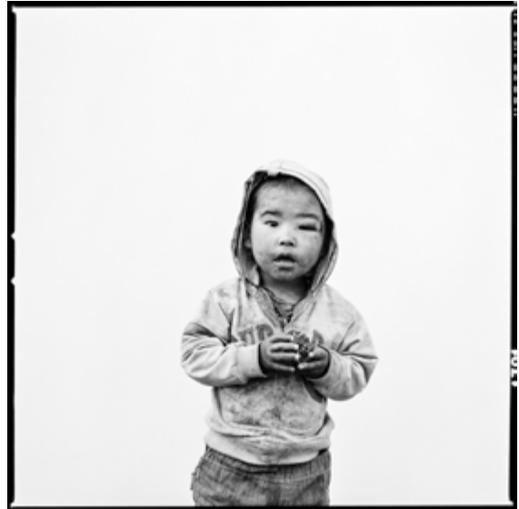
Rémi Chapeaublanc, Bold , 2017, impression jet d'encre pigmentaire sur papier Baryté Hahnemühle, 30 x 30 cm