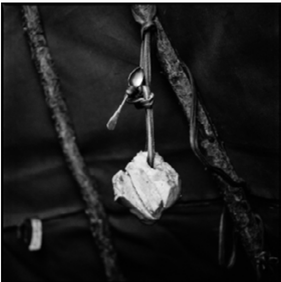
Rémi Chapeaublanc, Graisse dans un tipi , 2017, impression jet d'encre pigmentaire sur papier Baryté Hahnemühle, 100 x 100 cm