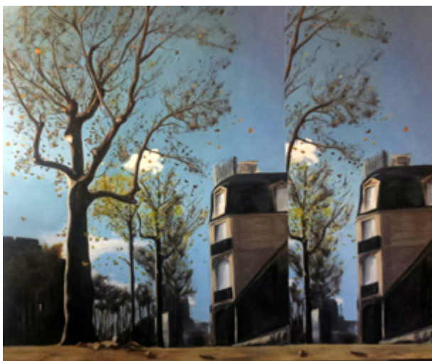
Alexandre Carin, Le Jardin aux sentiers qui bifurquent , 2016, huile sur toile, 155 x 190 cm