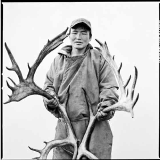
Rémi Chapeaublanc, Kiziik Ool , 2017, impression jet d'encre pigmentaire sur papier Baryté Hahnemühle, 100 x 100 cm