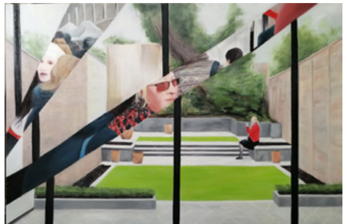
Alexandre Carin, Susannah , 2018, huile sur toile, 82 x 122 cm