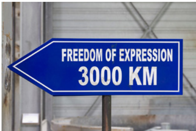
Motaz Nasr, Freedom of Expression 3000 Kilometers , 2015, 2 panneaux urbain sur pieds, panneaux : 26 x 80 cm, pied : 180 cm de hauteur