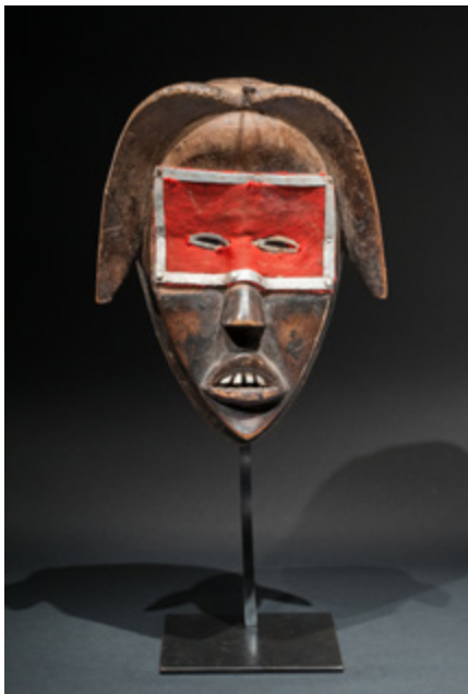
Masque Dan, Circa 1930, bois oxydé par endroit, clou, tresse droite restaurée sur place avec deux clous, 27 cm