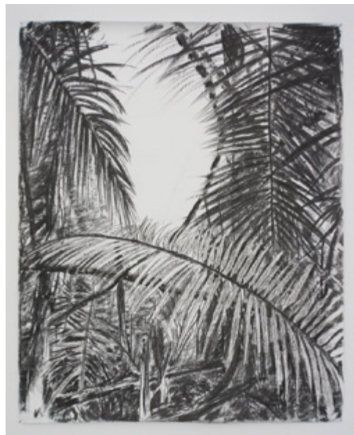
Arthur Novak, Point de vue n°11 , 2017, fusain sur papier, 200 x 150 cm