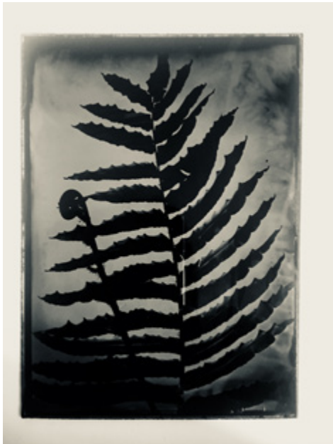
Ritual Inhabituel, Herbiere Mapuche , 2016, collodion humide sur plaque de verre, 12 x 10 cm