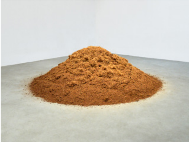
Caroline Le Méhauté, Négotiation 57 - Grow, Grow, Grow , 2013, terre de coco, Dimensions variables