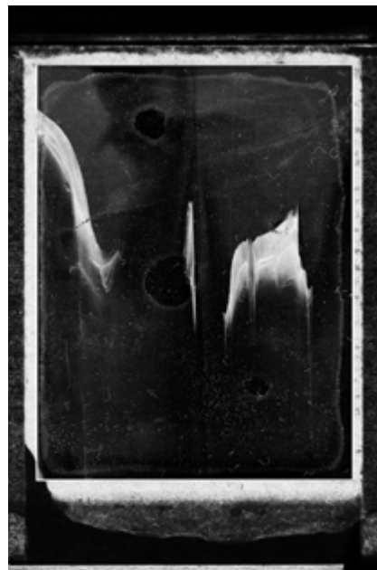
Sandrine Elberg, Corps Céleste , 2017, tirage jet d'encre, 100 x 70 cm