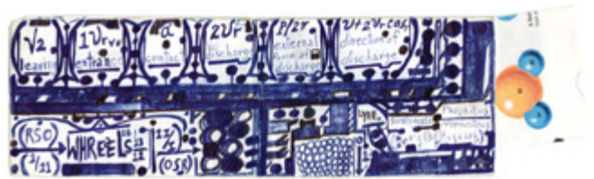
Melvin Way, Sans titre , 2011, stylo bille noir sur papier plié, 9 x 20 cm, Courtesy Galerie Christian Berst