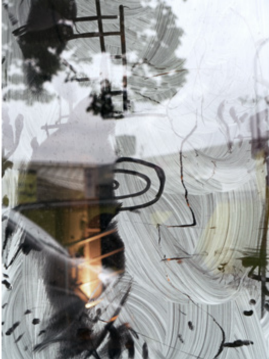
Alexandra Hedison, Found Paintings #4 (The In Between) , 2017, Impression jet d'encre sur papier de qualité muséale, 82,67 x 62 cm, Edition de 5