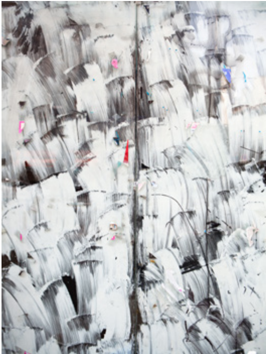
Alexandra Hedison, Found Paintings #1 (The In Between) , 2017, Impression jet d'encre sur papier de qualité muséale, 138 x 92 cm, Edition de 5