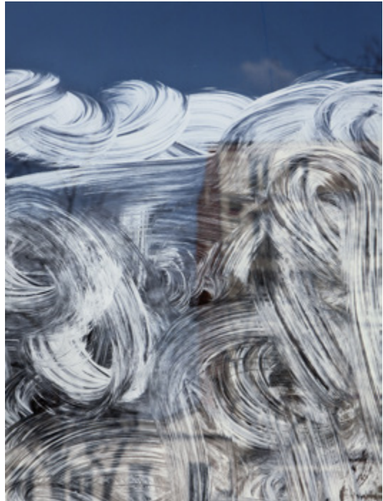
Alexandra Hedison, Found Paintings #12 (The In Between) , 2017, Impression jet d'encre sur papier de qualité muséale, 82,67 x 62 cm, Edition de 5