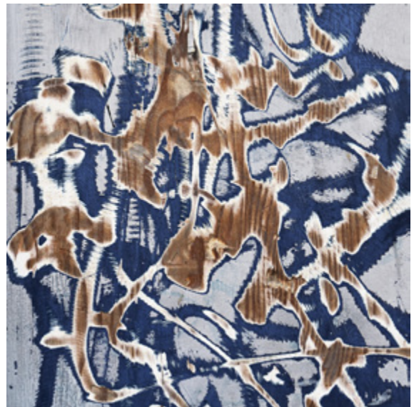
Alexandra Hedison, Found Paintings #38 (The In Between) , 2017, Impression jet d'encre sur papier de qualité muséale, 42 x 42 cm, Edition de 5