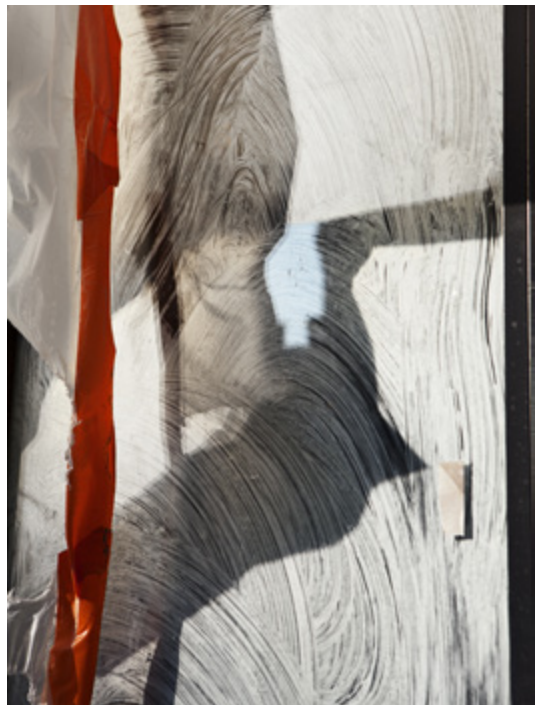
Alexandra Hedison, Found Paintings #6 (The In Between) , 2017, Impression jet d'encre sur papier de qualité muséale, 82,67 x 62 cm, Edition de 5