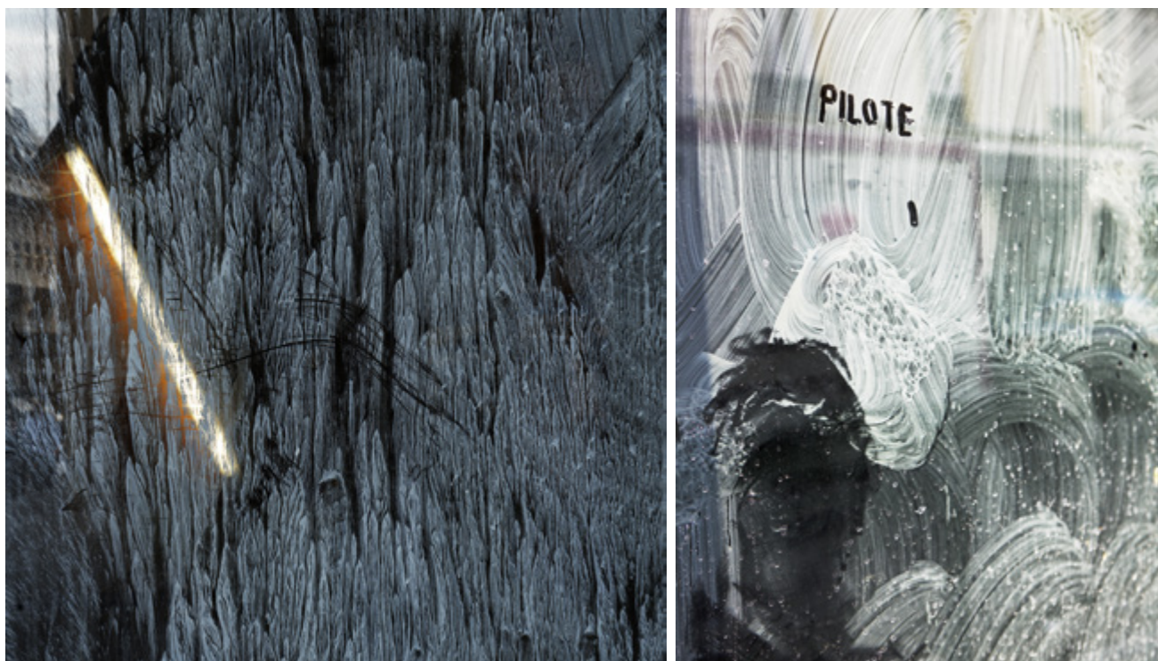
Alexandra Hedison - Found Paintings #22 [The In Between] - 2017 - Archival Ink Jet Print on paper - 42 x 42 cm Alexandra Hedison - Found Paintings #2 [The In Between] - 2017 - Archival Ink Jet Print on paper - 82,67 x 62 cm

On October 12th, 2017, Los-Angeles based American photographer Alexandra Hedison will premiere her new series of photographs entitled The In Between at H Gallery . This will also be the first solo-exhibition of the artist in Paris and an homage to the City of Lights.