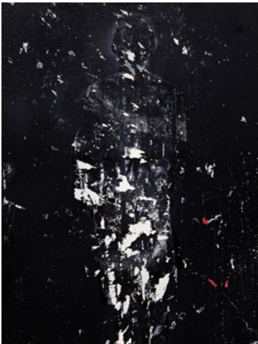
Alexandra Hedison, Found Paintings #3 (The In Between) , 2017, Impression jet d'encre sur papier de qualité muséale, 82,67 x 62 cm, Edition de 5