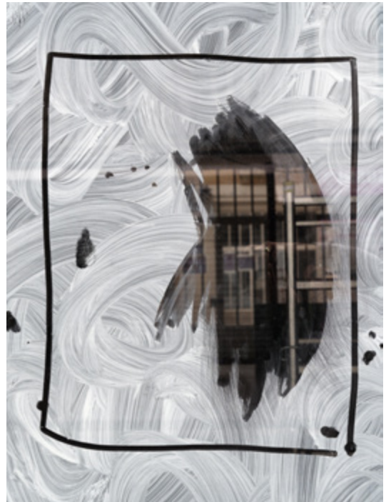
Alexandra Hedison, Found Paintings #29 (The In Between) , 2017, Impression jet d'encre sur papier de qualité muséale, 42,67 x 32 cm, Edition de 5