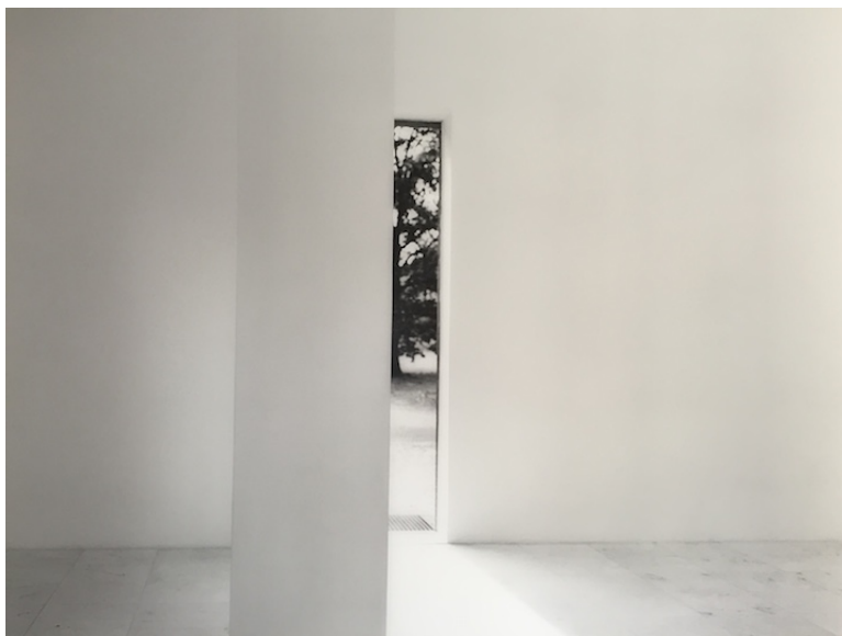
Seton Smith, Insel #1 , 2013, impression jet d'encre, 97 x 120 cm