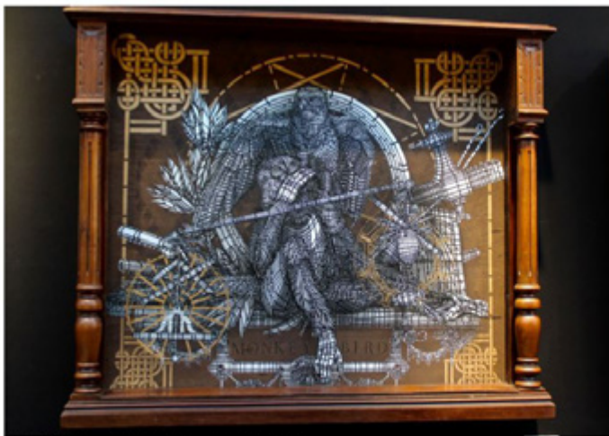
Monkey Bird sur le 'wall of fame' de l'Artistik Rezo.

Un bel éclectisme qui devrait permettre à cette édition de rencontrer le même succès que l'an passé, où près de 20 000 visiteurs s'étaient pressés. La preuve en quatre faits et en images.