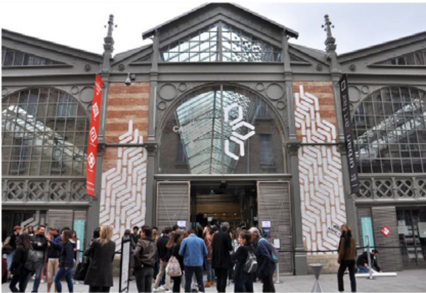
Urban Art Fair Entrance - The venue was packed with visitors from across the globe