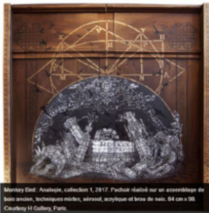
Monkey Bird - Analogie, collection 1, 2017. Pochoir réalisé sur un assemblage de bois anciens, techniques mixtes, aérosol, acrylique et brève de saie. 84 cm x 98.