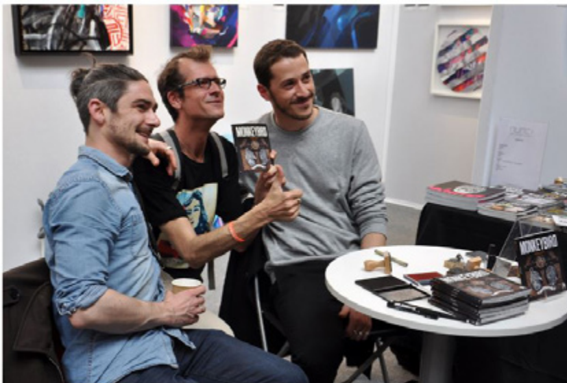
Book signing Monkey Bort on H-Gallery booth