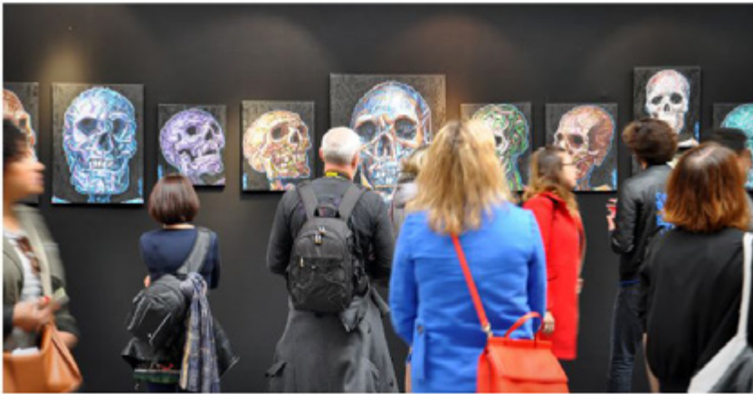
NDMART on H-Gallery Paris booth