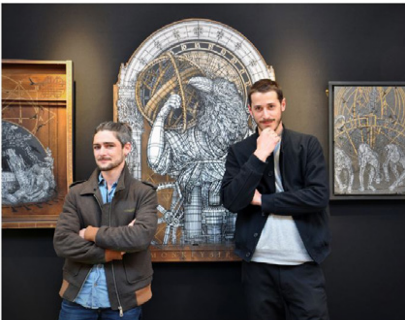
The duo behind the Monkey Bird Crew presented on H-Gallery Stand