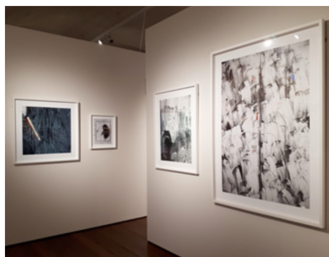
Exhibition views, Photo London , London, United Kingdom, 2018

90, rue de la Folie-Méricourt 75011 PARIS +33 (0)1 48 06 67 38 galerie@h-gallery.fr www.h-gallery.fr