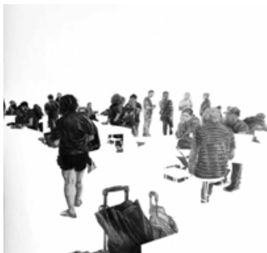
Axel Roy, Inter(Act) , 2021, graphite sur papier, 40 x 40 cm