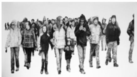
Axel Roy, Nadir , 2021, graphite sur papier, 150 x 300 cm