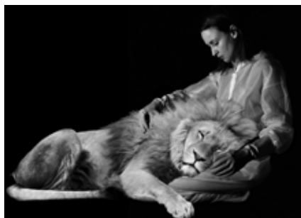
Maryline Terrier, Pietà au lion , 2021, graphite sur papier, 60 x 90 cm