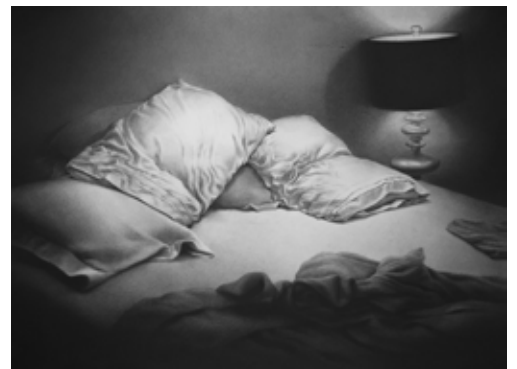
Reuben Negrón, Echoes 10 (bed) , 2021, fusain sur papier monté sur aluminium, 56 x 76 cm