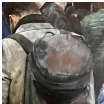
Axel Roy, Monochrome II , 2021, huile et acrylique sur papier, 40 x 40 cm